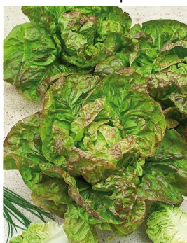
Laitue d'hiver brune passion