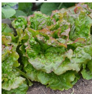
Batavia rouge grenobloise