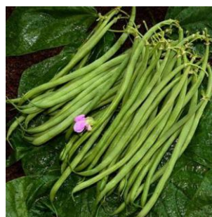
Haricot nain Mascaret