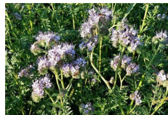
Phacélie –Engrais vert